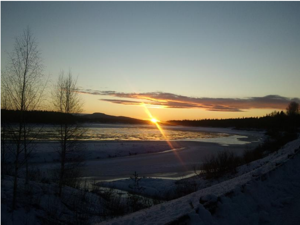
Solen som högst alldeles vid Polcirkeln i Juoksengi julafton 24 dec 2011 kl 12.00.

Polcirkeln utgör också den gräns norr om vilken polarnatten uppstår i december månad. Den 22 december ligger solen som högst just vid horisonten. Om detta skrivs på Wikipedia: ”Strax norr om norra polcirkeln varar polarnatten några dagar kring vintersolståndet. Här är dock solen så nära under horisonten att det rör sig om skymnings/gryningsljus mitt på dagen. Man måste komma norr om ungefär 72 breddgraden för att det ska upplevas som mörkt mitt på dagen.”