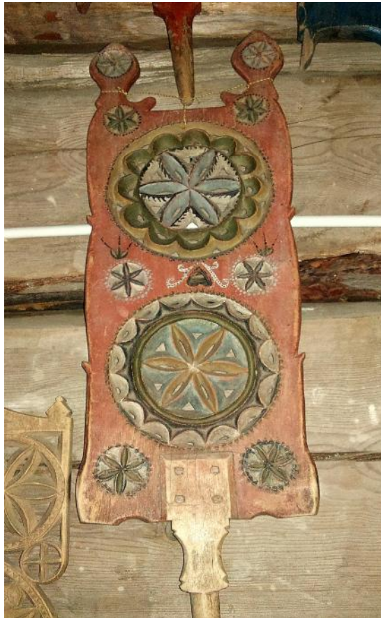
Exempel på rockblad. Matarengi hembygdsmuseum, Övertorneå.

Symbolen till höger har de typiska färger som finns i Lovikkavantens dekor. Samma färgnyanser hittas i de kvinnliga folkdräkter som förekommit i Tornedalen, det vill säga engelskt rött, gult och grönt.